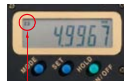
ファンクションロック

ABSOLUTE Absolute System Patented by MITUTOYO