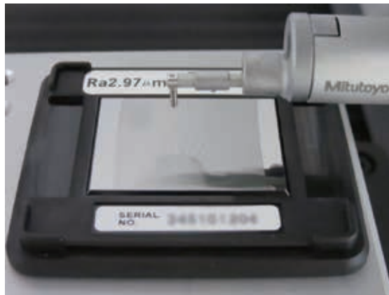
対象製品コード No.178-601, 178-601-1, 178-604, 178-605

ミットヨ営業サービス統括本部は、JIS Q 17025 (ISO/IEC 17025) の適合基準に基づく、表面性状（粗さ標準片）の国際 MRA 対応 JCSS 認定を取得しております。