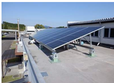
太陽光発電装置 [宮崎]